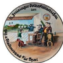
Damenscheibe, gest. von Stadtverband für Sport