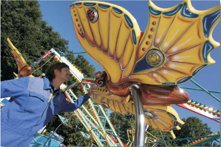
Sicherheit geht vor – TÜV SÜD bei der Arbeit