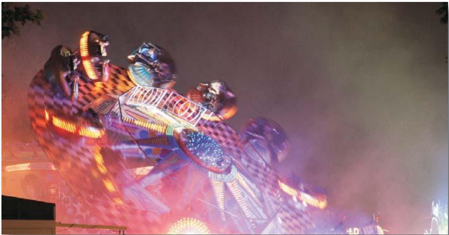
Spektakulär: Flipper – Kultkarussell –